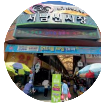
서남신시장 Seonam New Market