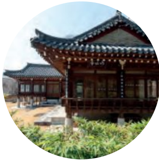
월곡역사공원 & 월곡역사박물관 Wolgok Historical Park & Museum