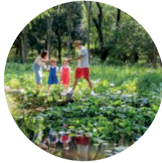
대구수목원 & 선사시대로 Daegu Arboretum & Prehistoric Way