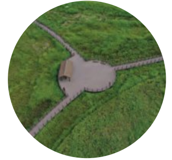
대명유수지 Daemyung Reservoir