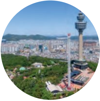
이월드 & 83타워 E-world and 83 tower