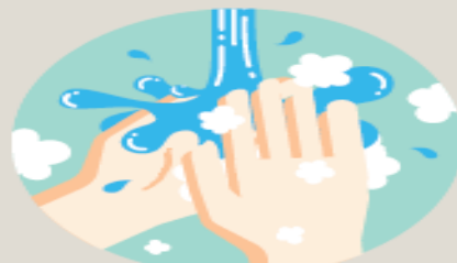
손 자주 씻기