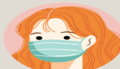
마스크 착용 필수