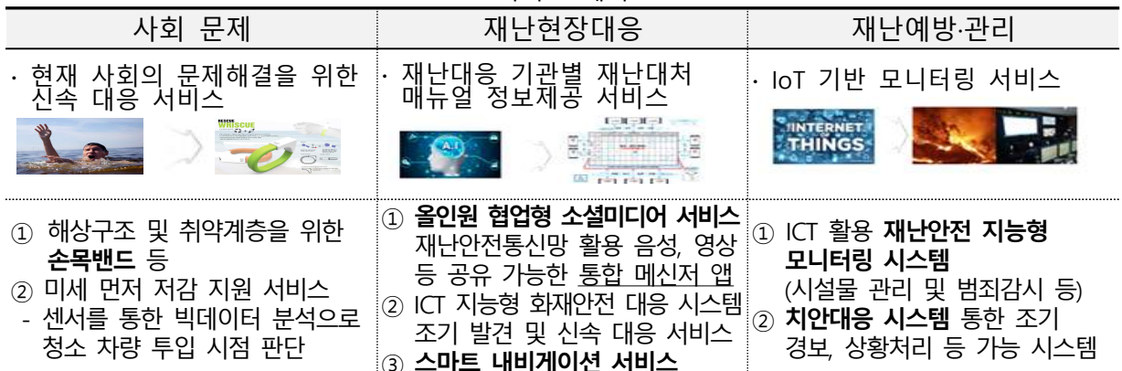
< 서비스 예시 >