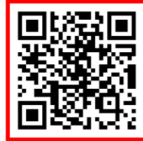
[ FLEX 수험서 구입 ]