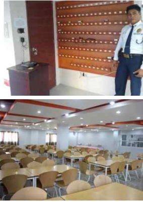
▲ 정문 보안과 식당