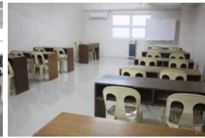
피트니스 / 탁구장 / 시청각실 ▲