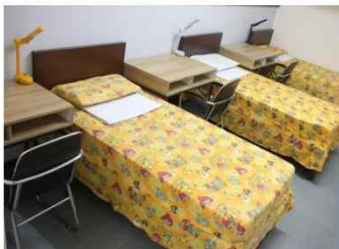
▼ 3인실 내부( 침대/책상/에어컨/냉장고/운수기/옷장/화장실)