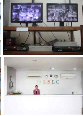
CCTV와 안내카운터 ▲