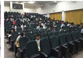
[MM A&B 강의실]